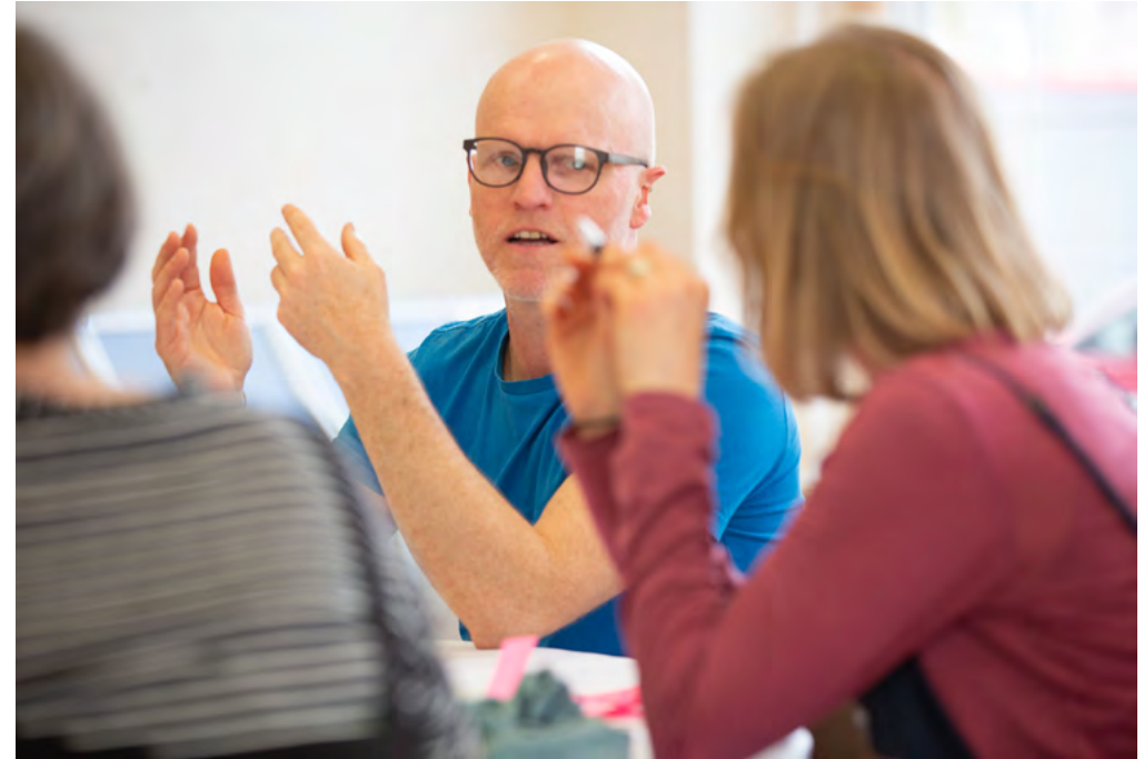
Diwrnod Rhannu

Y nod yw archwilio dull newydd o ariannu hirdymor ar gyfer artistiaid a chymunedau unigol, gan ddefnyddio arian loteri i greu galwad agored fydd yn edrych ar bosibiliadau gyda phwyslais cryf ar ymchwil.