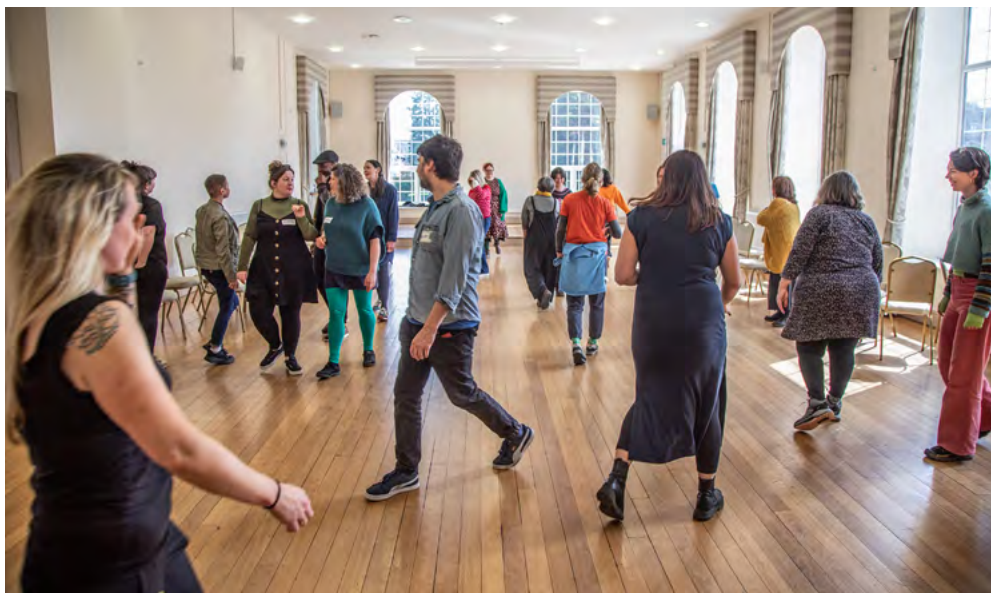
Diwrnod Rhannu

Ni fyddwn ni'n ariannu cais lle nad oes ffi ar gyfer chi eich hun neu eich cydweithwyr neu ddim ond ffi isel iawn, iawn sydd yn y gyllideb. Hoffem weld eich bod wedi cyfeirio at gyfraddau safonau diwydiant sy'n berthnasol i'ch ymarfer chi a dylech chi o leiaf dalu cyfraddau lleiaf y diwydiant. Lle nad oes cyfraddau lleiafsymiol i'r diwydiant ar gael, rhaid ichi dalu'r Cyflog Byw Cenedlaethol o leiaf.