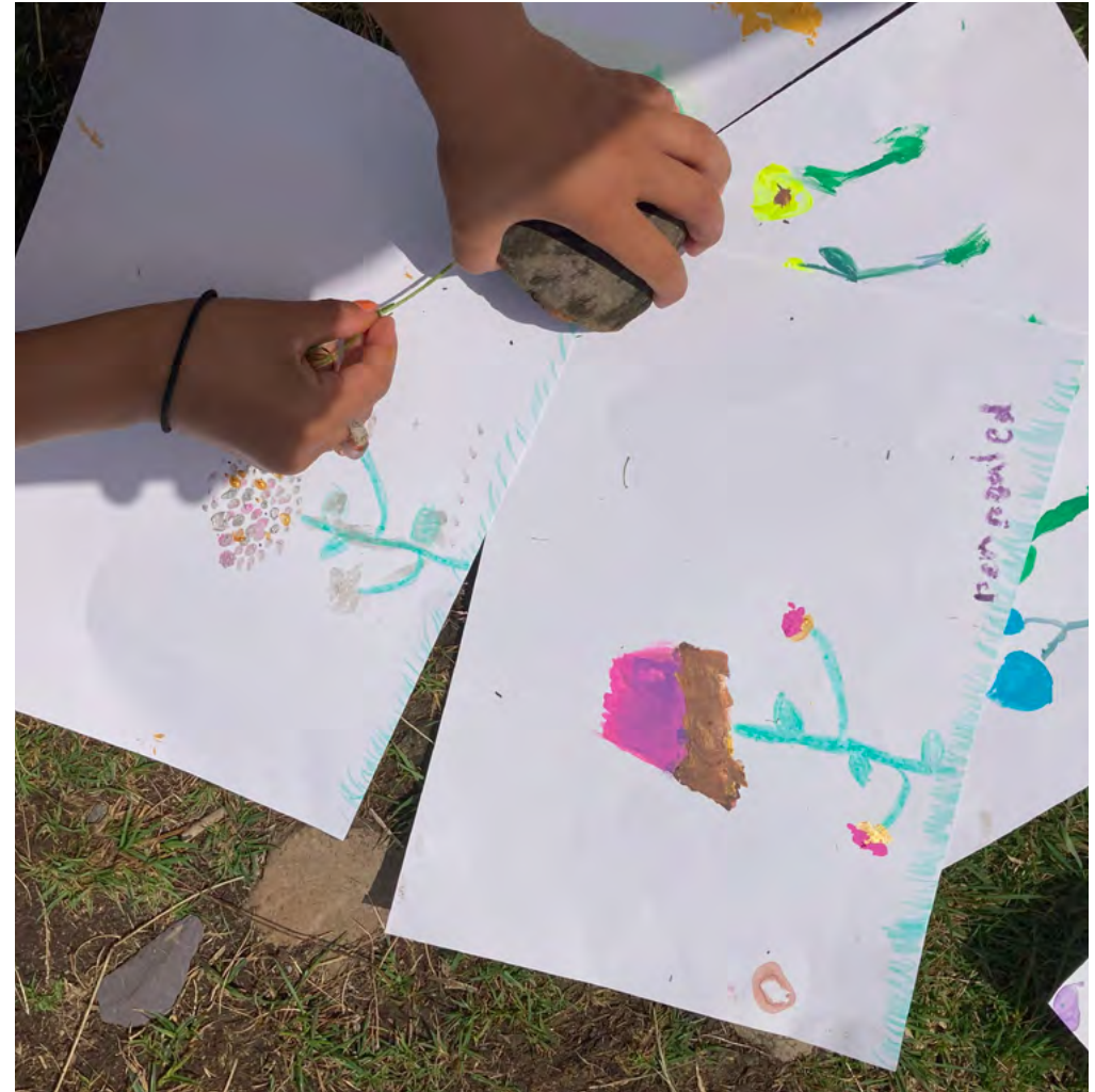
Helfa Drysor Blodau Gwyllt, Baladeulyn

Gallai'r wefan hon eich helpu i olrhain yr oriau gwirfoddol a roddir i'r prosiect: www.volhours.com