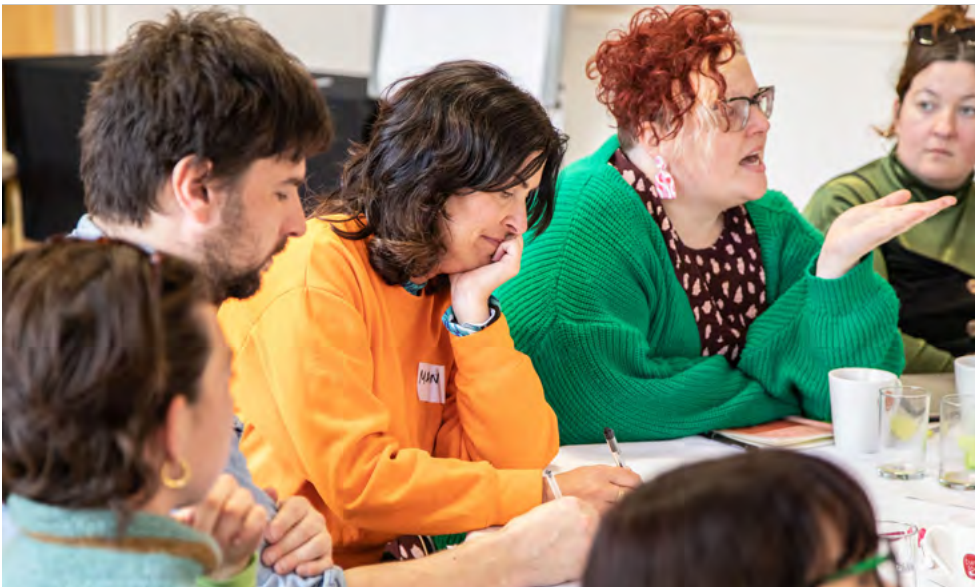
Diwrnod Rhannu

Rydym yn chwilio am syniadau fydd yn darganfod ffyrdd creadigol o weithredu a gosod sail cadarn i ddatblygu at y dyfodol. Rydym eisiau ceisiadau fydd yn greadigol a rhagweithiol wrth fynd i'r afael â'r cwestiwn.