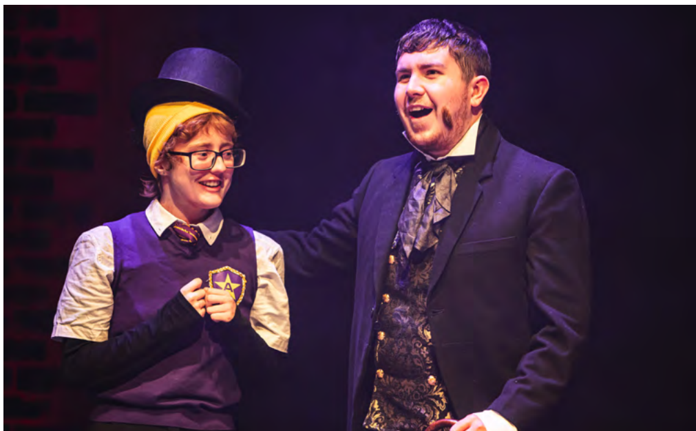
HUMBUG!, sioe Nadolig grŵp theatr gymunedol Hijinx, Odyssey.