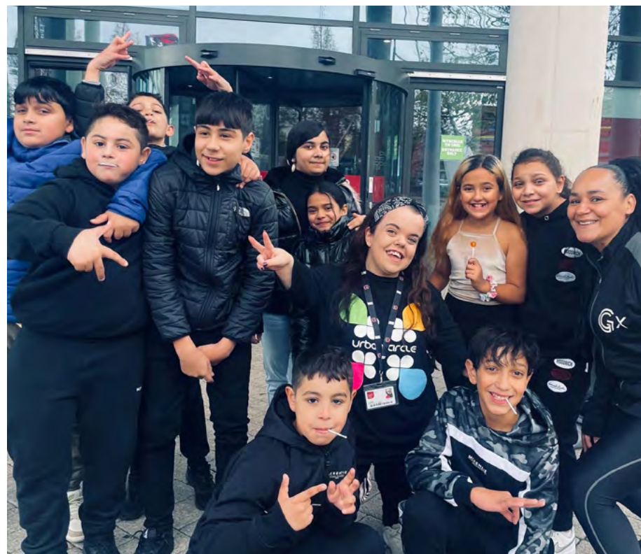
Urban Circle

“Helpodd y rhaglen Camau Creadigol i ddatblygu ein drafft cyntaf o'n cynllun busnes, creu'r model strwythur sefydliadol cywir (ailymgorffori G-Expressions) a'r cynllun ariannol i'n helpu i dyfu a mynd i'r afael ag anghenion pobl ifanc Casnewydd mewn modd cynaliadwy.”