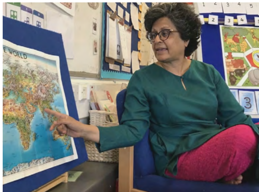
Cynefin: Cymru ddiwylliannol ac ethnig amrywiol, Cynllun Dysgu Creadigol