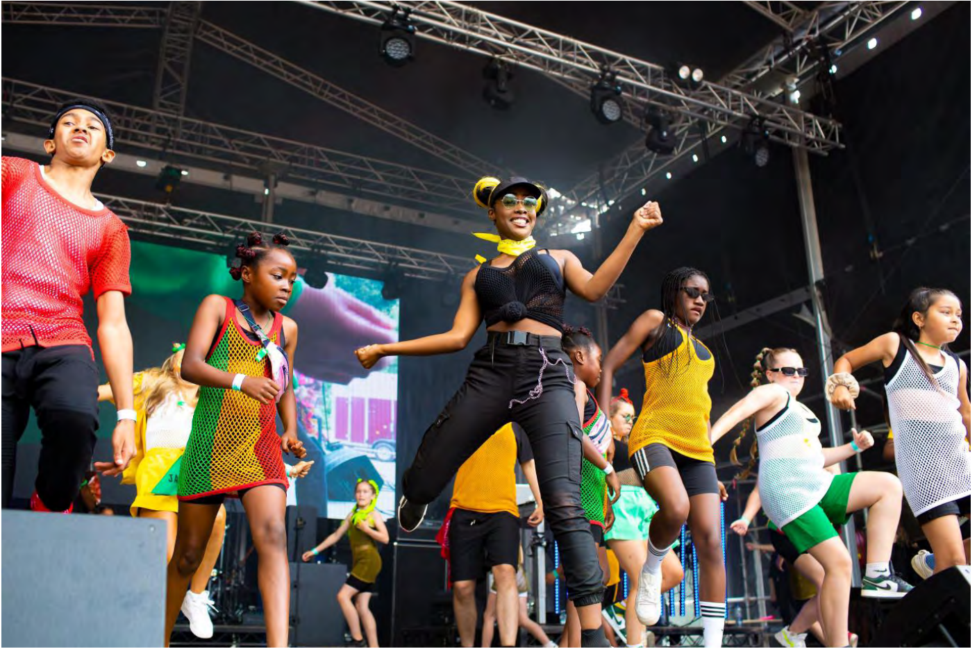
Urban Circle

Yn ogystal â cheisiadau gan sefydliadau ieuenctid dynodedig, megis Celfyddydau Cenedlaethol Ieuenctid Cymru, cafodd pobl ifanc eu hystyried yn helaeth drwyddi draw, gyda'r ymatebion cryfaf yn dod gan ymgeiswyr yn mynegi dyhead i roi pŵer strwythurol, gwirioneddol i leisiau iau. Mae ein hymchwil wedi dangos yn rheolaidd bod pobl ifanc yn absennol yn systemaidd o fyrdau sefydliadau celfyddydau, gyda dim ond dau y cant o aelodau byrddau Portffolio Celfyddydol Cymru dan 30 oed yn 2022/23. Mae sefydliadau fel Cwmni'r Frân Wen, ac Urban Circle yng Nghasnewydd, yn arwain y ffordd o ran rhoi plattform i leisiau pobl ifanc, a sicrhau bod y lleisiau hynny wrth galon prosesau penderfynu a llywodraethu. Er y bydd canran aelodau byrddau sy'n bobl ifanc yn codi'r flwyddyn nesaf i dri a hanner y cant, mae angen gwneud llawer mwy o waith i ddatblygu arweinyddiaeth a chyfleoedd strategol i bobl ifanc.