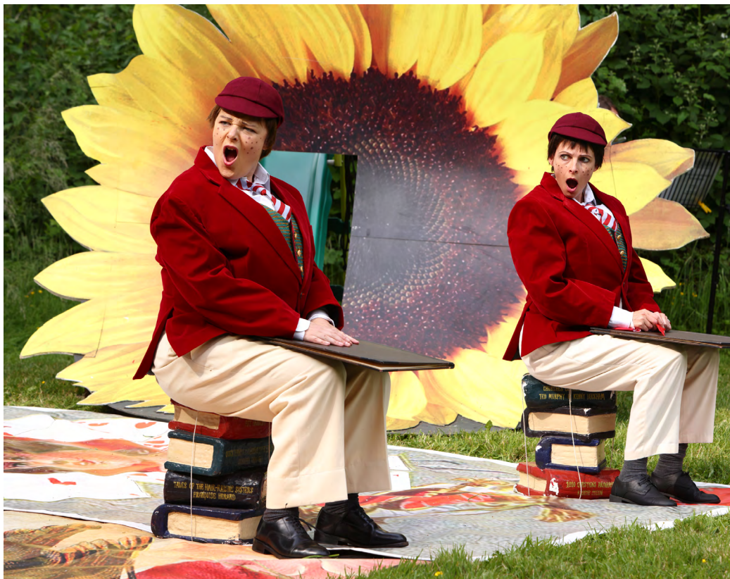
Opera Cenedlaethol Cymru, Alice's Adventures in Wonderland

Ymysg y rhai sy'n gweithio'n rhyngwladol, ceir rhywfaint o gydnabyddiaeth bod angen newid ffyrdd o weithio. Mae Opera Cenedlaethol Cymru yn gweithio ar greu strwythur teithio o'r math gorau posibl a bydd yn osgoi bylchau rhwng wythnosau teithio lle bo modd er mwyn gwneud y defnydd gorau o'r drefn llogi a storio cyfarpar a cherbydau.