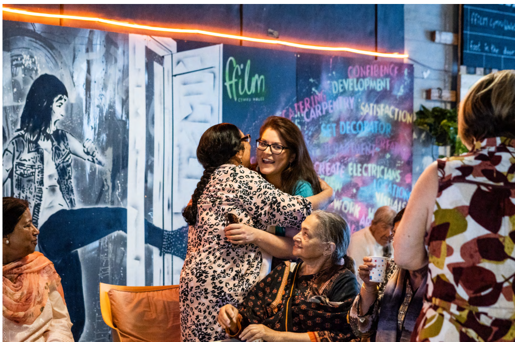
Ffilm Cymru, Troed yn y Drws – Bangla Surf Girls

O ganlyniad i'r cynnydd yn ein buddsoddiad mewn celfyddydau iechyd a lles yn y blynyddoedd diwethaf, gwelsom gynnydd yn nifer y ceisiadau llwyddiannus a gafwyd gan sefydliadau sy'n canolbwyntio ar y meysydd hyn, gan gynnwys Rhwydwaith Iechyd a Llesiant Celfyddydau Cymru, Re-Live yng Nghaerdydd a People Speak Up yn Llanelli. Mae'r sefydliadau sy'n adeiladu ar y gwaith a wnaed eisoes yn y maes hwn yn cynnwys Canolfan Grefft Rhuthun, SPAN Arts, Cwmni Dawns Cenedlaethol Cymru ac Opera Genedlaethol Cymru. Roedd Theatr Bara Caws hefyd yn cynnig cynlluniau cyffrous yn y maes hwn.