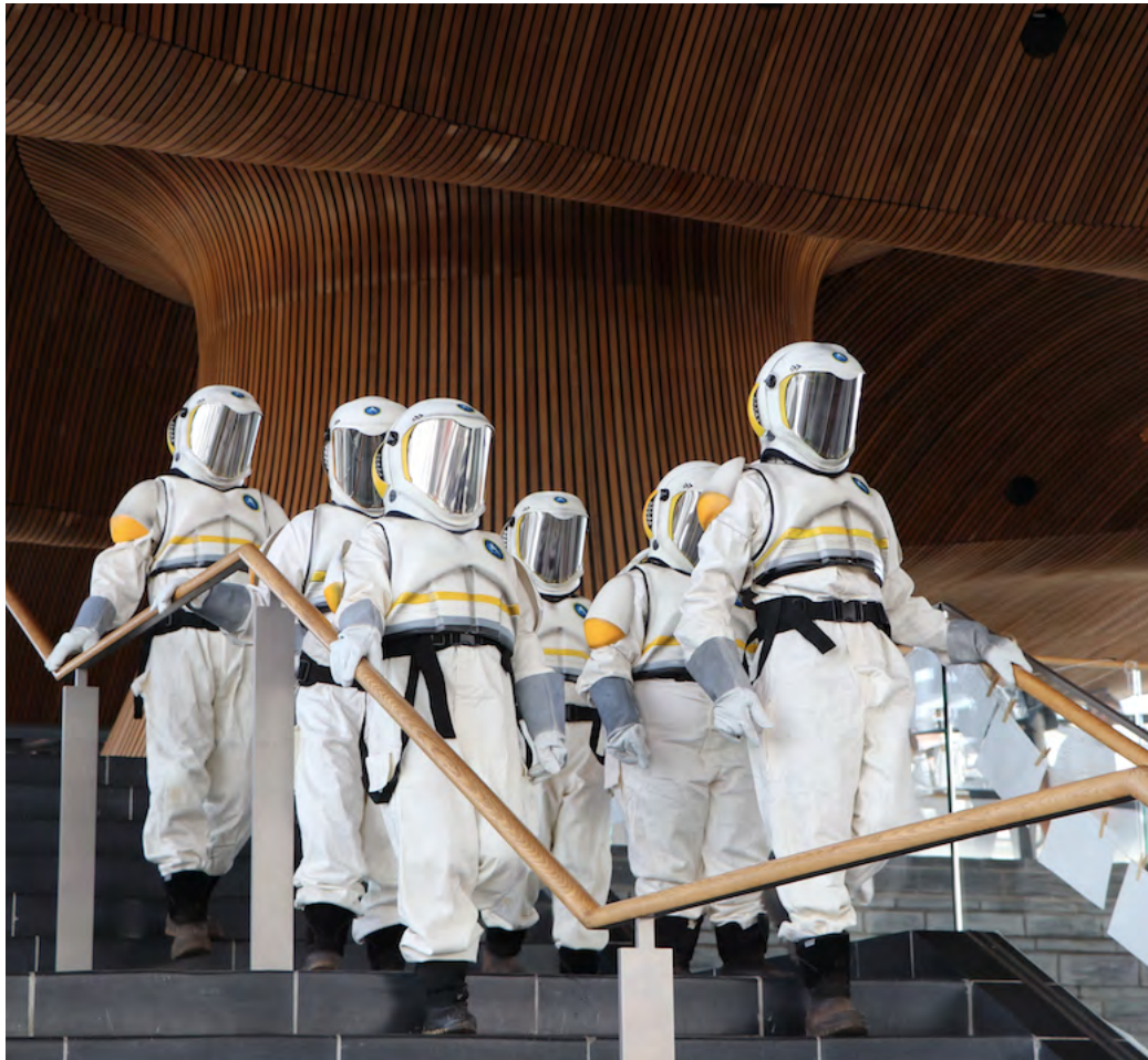
The Astronauts, Hijinx

Mae rhai o'r cynigion cyffrous a gafwyd yn y sector theatr yn cynnwys mwy o gefnogaeth i'r cwmni theatr gynhwysol Hijinx er mwyn datblygu ei waith ar lefel genedlaethol. Mae'r buddsoddiad hwn yn adlewyrchu datblygiad mawr i artistiaid ag anabledd dysgu ac artistiaid niwroamrywiol yng Nghymru. Mae arian ar gael i gwmnïau theatr arbenigol hefyd. Mae'r rhain yn cynnwys: Fio, sy'n cefnogi pobl y mwyafrif byd-eang o bob oed; Theatr Taking Flight, sy'n gweithio tuag at gynrychiolaeth gyfartal i bobl F/fyddar ac anabl yn y sector theatr; a Common Wealth, sy'n gweithio gyda chymunedau dosbarth gweithiol yn nwyrain Caerdydd, a gaiff eu hesgeuluso'n aml gan sefydliadau celfyddydol. Mae'r cwmnïau hyn wedi'u lleoli yn y brifddinas ond maent yn gweithio'n ystyrlon a dilys gyda chymunedau sydd heb gael gwasanaeth digonol gan y celfyddydau.