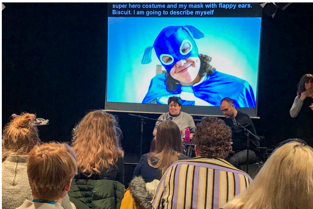
Taking Flight, Symposiwm Mynediad a Chynhwysiant

I wneud hyn, defnyddiwyd bum ffactor cydbwysu yng nghamau olaf ein proses wrth inni ystyried y sefydliadau y gallem eu hariannu. Y ffactorau yw: gwasanaethu cymunedau ledled Cymru; ystod eang o gelfyddydau a chyfleoedd creadigol; lleisiau sydd wedi'u tanariannu ac sydd ddim yn cael eu clywed; gwerth cyhoeddus; a maint a ffurf sefydliadau sy'n ymgeisio.