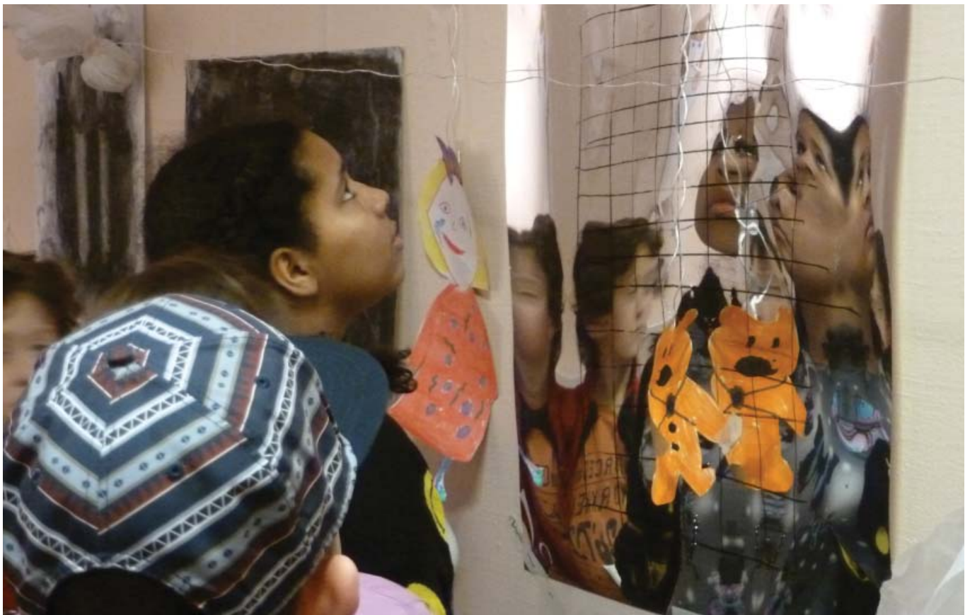
Criw Celf yn Oriol Myrddin