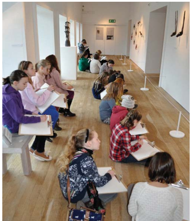
Criw Celf yng Nghanolfan Grefft Rhuthun

Mae stori weledol Criw Celf yn hanfodol hefyd, felly ochr yn ochr â'r adroddiad hwn dylech gyflwyno delweddau a ffilmiau byr a grëwyd gennych yn ystod y rhaglen i gefnogi'r gwerthuso ac i helpu i ddangos beth yw'r canlyniadau.