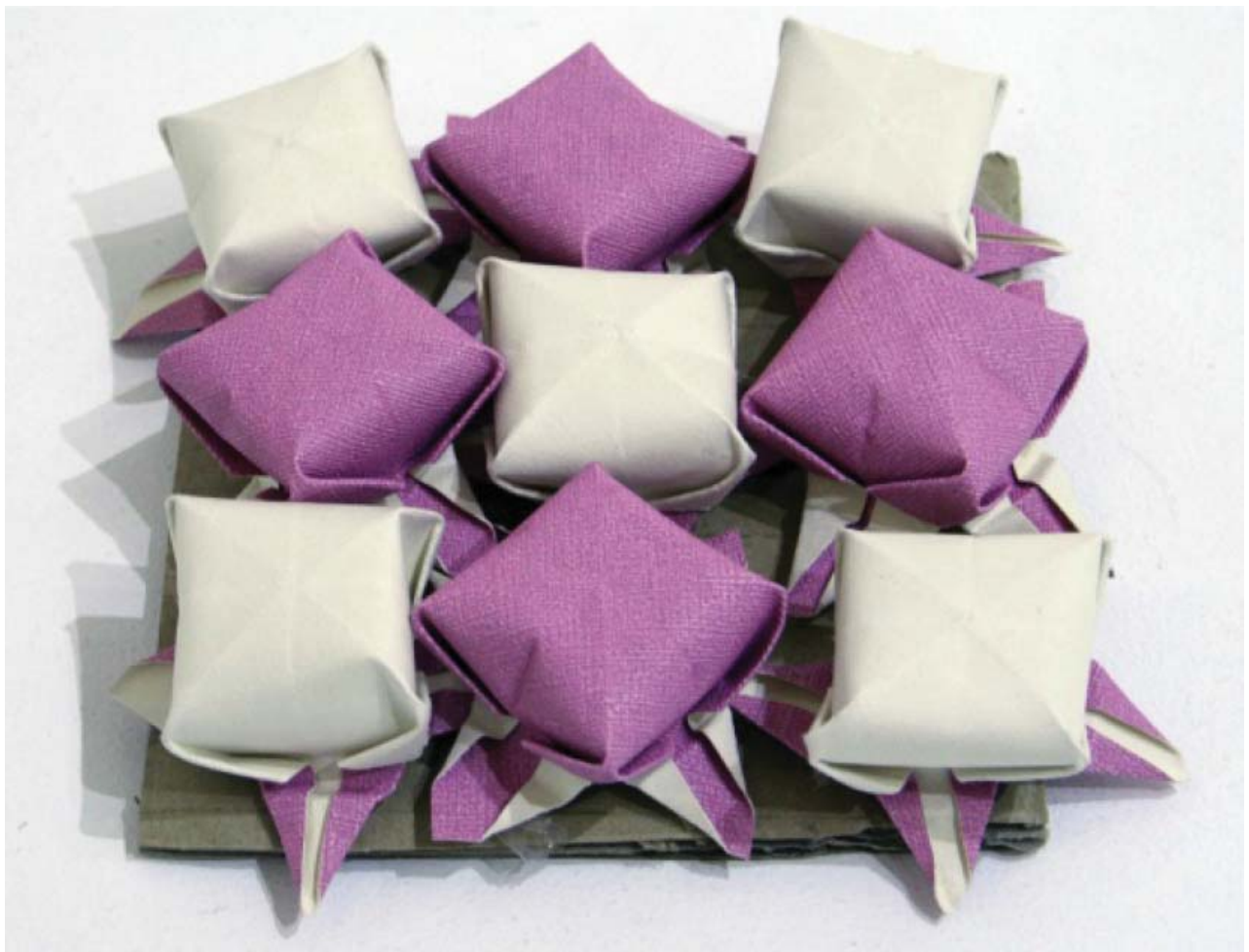
Gwaith gan gyfranogwyr Criw Celf Castell-nedd Port Talbot a Sir Gaerfyrddin a ddangoswyd yn Oriol Mission

Mae rhieni mewn safle da i gynnig adborth ar sut mae hyder a dyheadau eu plentyn wedi newid (Gweler Offeryn 9 tudalen 17).