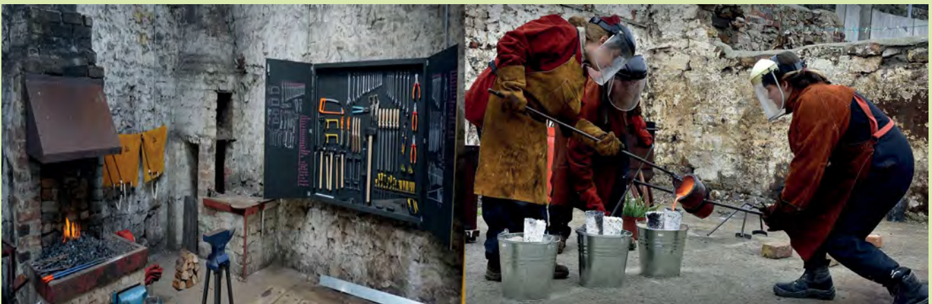
Fel rhan o brosiect STAMP, yn hen safle'r Cei Llechi yng Nghaernarfon, adferwyd yr hen efail fel gefail gymunedol dros dro a chanolbwynt i roi prawf ar ddefnydd o'r safle yn y dyfodol.

Nod SPLL oedd creu'r amodau lle gallai ymyriad yr artist/artistaidd unigol mewn partneriaeth ag ymgyrchwyr cymuned a thrigolion gael llawer mwy o effaith, a chredwn ei fod wedi llwyddo yn hyn o beth. Yr oedd SPLL eisiau ymchwilio a llunio sefyllfaoedd lle'r oedd yr artist ar y cyd â chymunedau a mudiadau oedd yn bartneriaid yn ymwneud yn ganolog â phob cam o'r broses adfywio a datblygu cymunedol, o ddechrau'r broses gaffael, oedd yn bwysig iawn. Yr oedd hyn yn gyfle i bobl, nid yn unig y gweithwyr adfywio proffesiynol, i fod yn rhan o'r broses o newid, nid y ddamcaniaeth. O ganlyniad, teg dweud, ar draws y 7 prosiect, fod syniadau am natur celfyddyd a'r rôl y gall yr artist chwarae yn ail-ddiffinio a lleisio egwyddorion datblygu adfywiol wedi datblygu ac aeddfedu'n sylweddol.