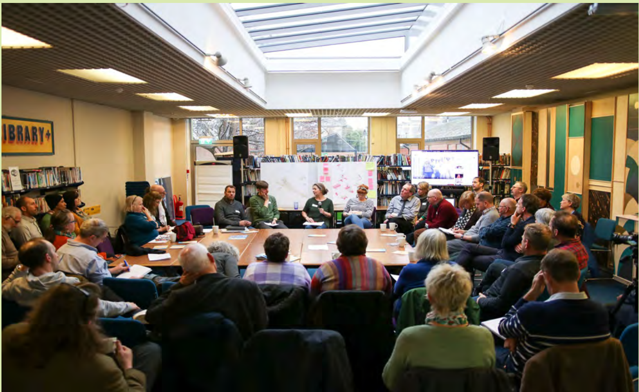
Gweithdy agored Darganfod Maendy - Rôl y celfyddydau i gydnabod lle

Yr oedd CCC yn glir hefyd na ddylid ymyrryd a chyfnod datblygu'r prosiect/consortia. Yn erbyn y cefndir hwn y rhagwelid yn wastad y byddai prosiectau yn cael eu cefnogi gan gyllid am 3-4 blynedd, a ystyrir, yng nghyd-destun y celfyddydau, yn dymor cymharol hir. Yr oedd i sicrwydd a roes hyn o ran amser yn rhoi i bobl y pellter hanfodol i ddod i adnabod ei gilydd ac i esblygu prosiectau oedd yn cynnwys y cyd-destun lleol gan deall gwybodaeth a safbwyntiau pawb oedd yn rhan o'r peth; ac a oedd, yn anad dim, yn rhoi gofod i ddeialog er mwyn wynebu ac ymdrin â gwerthoedd a dulliau o weithredu oedd weithiau yn gwrthdaro. Tra bod rhai consortia yn cael mwy o drafferth nag eraill, yn sicr fe ddaeth meithrin a rhoi blaenoriaeth i adeiladu perthynas yn fan cychwyn i symud tuag at ddiwylliant mwy cydweithredol a maes chwarae gwastad.