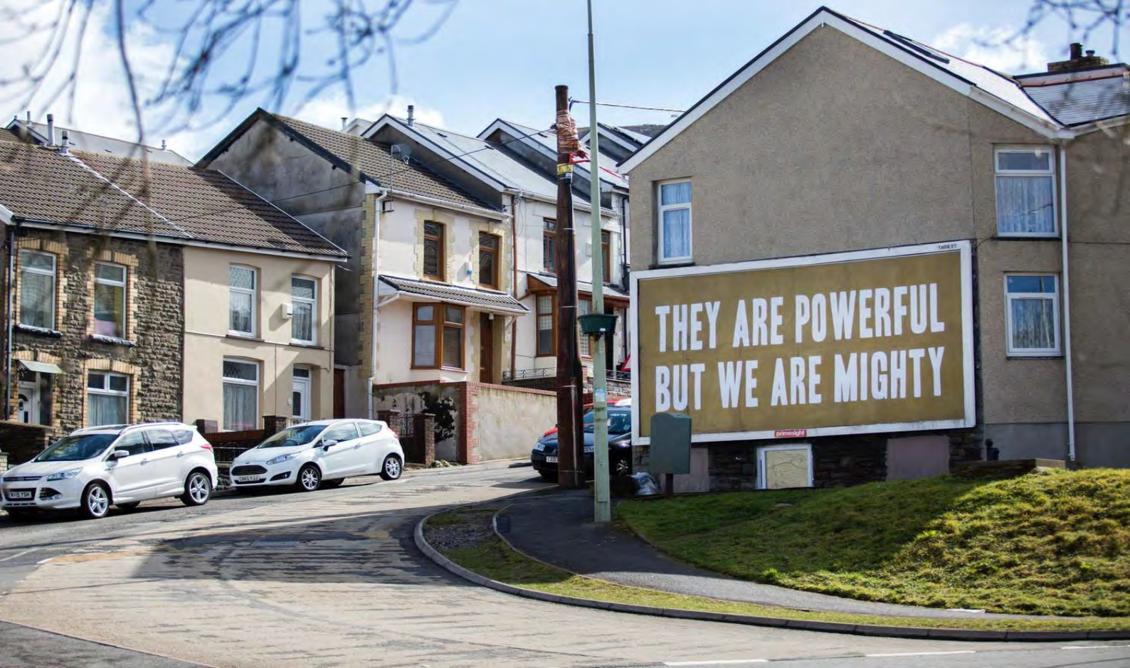
Celf gyhoeddus Penygraig gan yr artist Rabab Ghazoul.