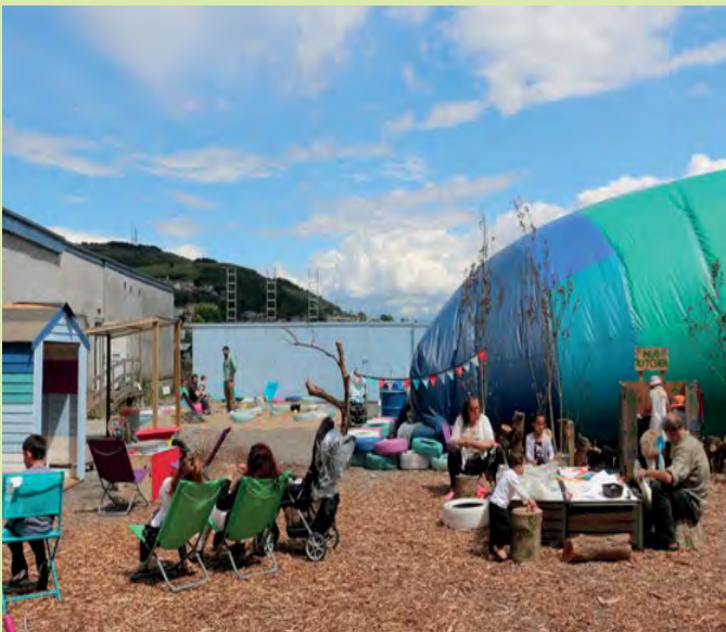
Parc poced ar Stryd Fawr Abertawe a grewyd yn ystod y prosiect Gorsaf i'r Môr

Tra bod cyflwyno SPLI yn deall fod diffyg cyfranogi cymunedol yn niweidiol iawn ac yn wrthgynhyrchiol pan nad yw'n bresennol yn y broses 'adfywio', daeth i'r casgliad hefyd y gall cyfranogi heb ymwneud a gweithredu sifig sylweddol drechu'r nod a gwyrô'r sawl sy'n cymryd rhan oddi wrth y llwybr. O'r herwydd, seiliwyd SPLI ar yr egwyddor y dylai cyfranogi gweithredol - ynghyd â galluogi trawsnewid cymunedol o ran dyheadau, ennyn hyder, hunanddatblygiad a pherchenogaeth greadigol - fod yn rhan hanfodol ac annatod o'r contract (cymdeithasol) SPLI.