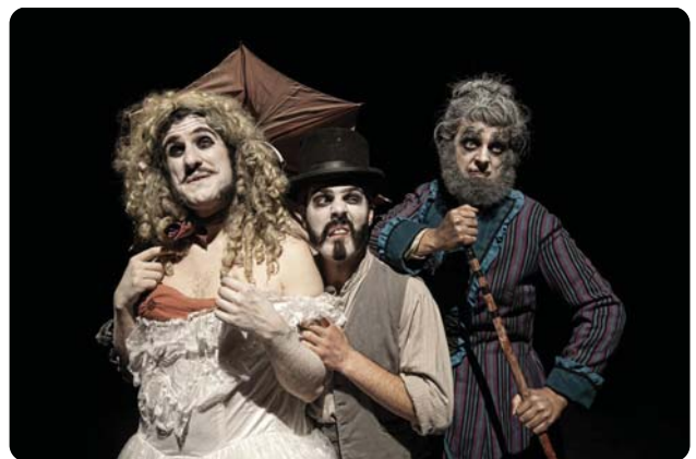
Dr Frankenstein's Travelling Freak Show, Tin Shed Theatre Company