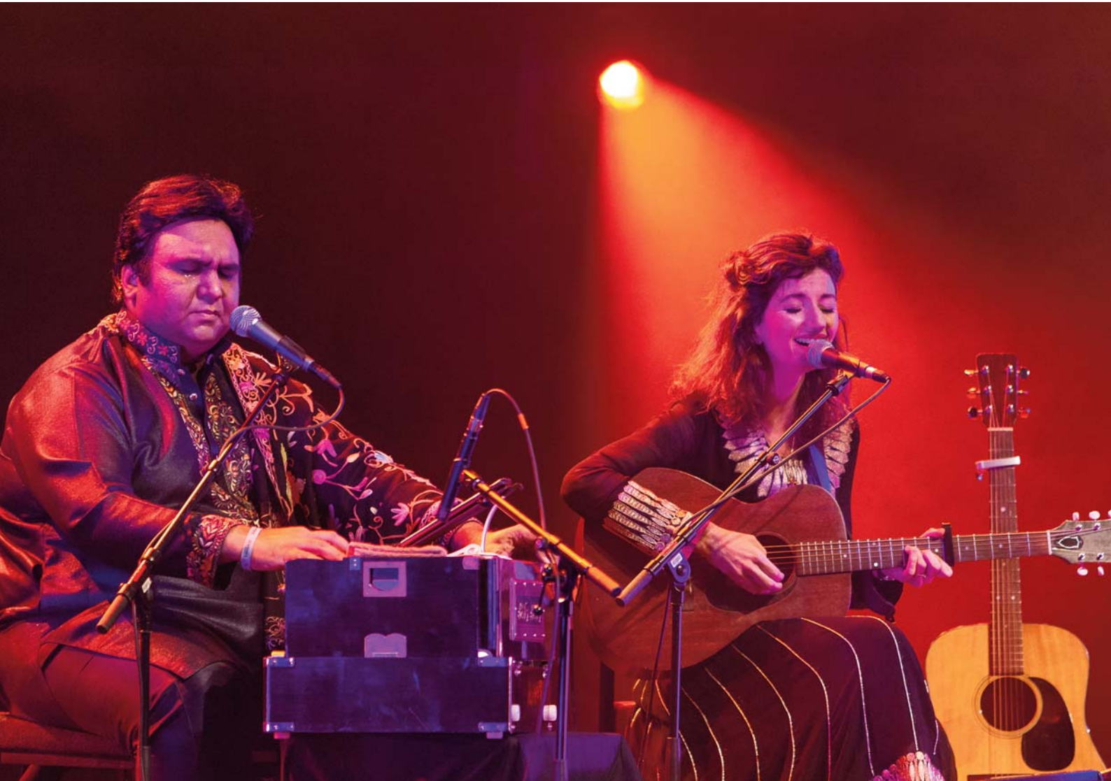
Ghazalaw, WOMEX 13

wales arts international celfyddydau rhyngwladol cymru