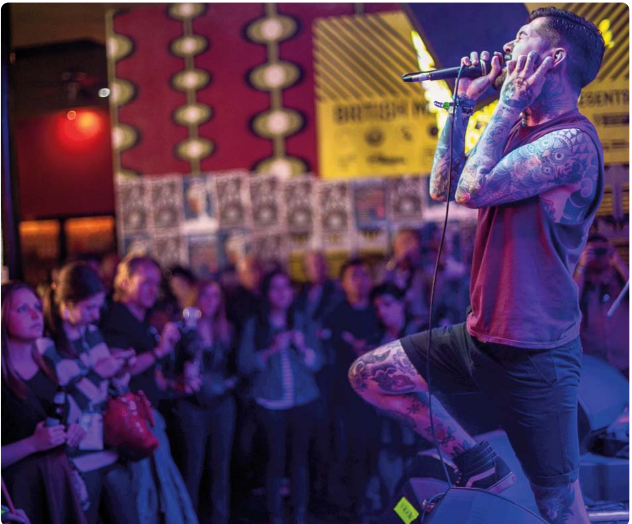
Save Your Breath, SXSW 2014

galluogi artistiaid a sefydliadau celfyddydol o safon uchel yng Nghymru i wireddu eu huchelgais ryngwladol drwy ehangu gorwelion, sbarduno talent a chysylltu â phartneriaid ysbrydoledig a marchnadoedd allweddol.