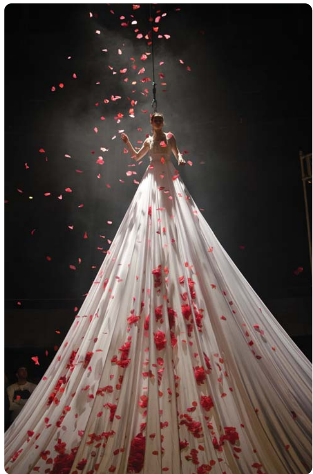
BIANCO, NoFit State