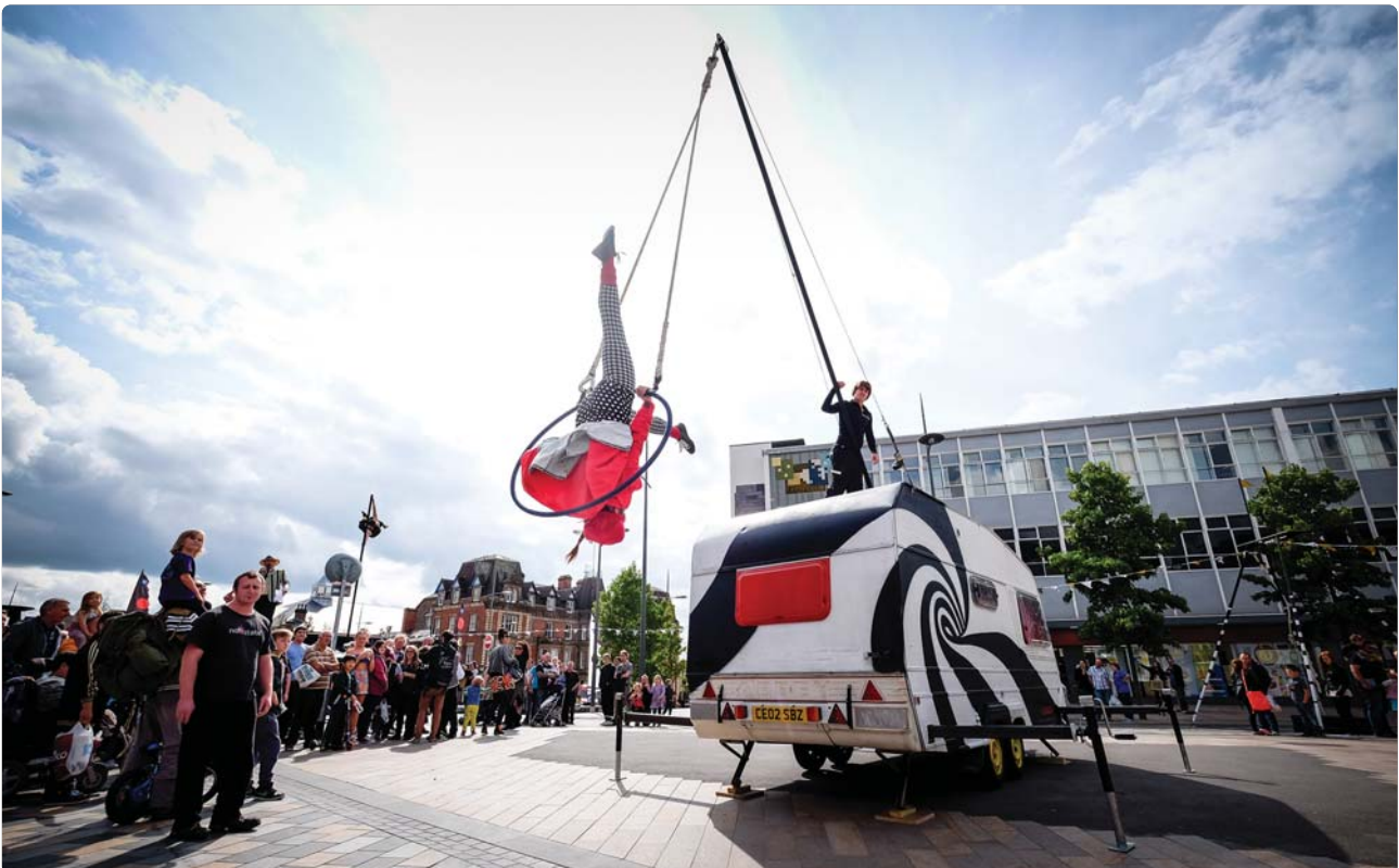
Open House, NoFit State

Edrychwn i'r dyfodol gyda hyder a ffydd. Soniwn am yr hyn y credwn ynddo a'r pethau yr hoffem eu gwneud. Soniwn am bwyslais a blaenoriaeth. A siaradwn mewn ffordd groesawgar a chynhwysol gan atynnu'r rhai a allai rannu, cefnogi a mowldio ein gweledigaeth. Ac os llwyddwn, dychmygwch yr hyn y gallem ei wneud. Dychmygwch y Gymru y gallwn ei chreu'n ddewr gyda'n gilydd.