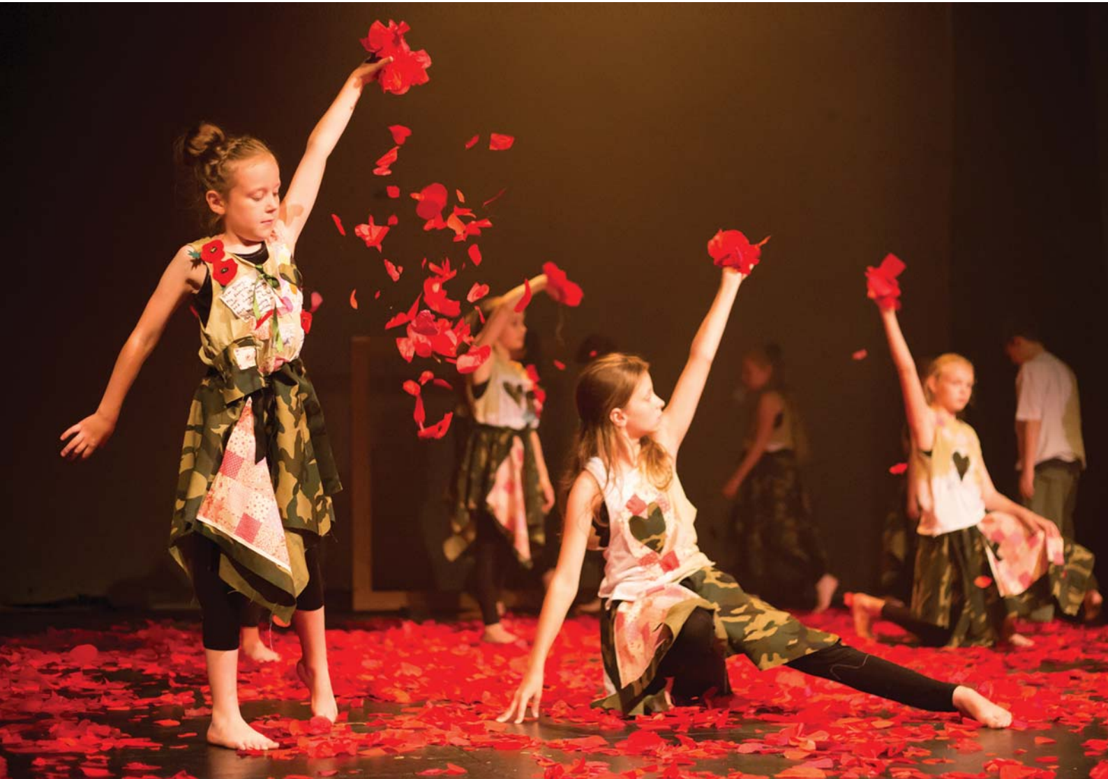
The Stories We Carry, Y Celfyddydau Perfformio ar gyfer Plant, Artis Cymuned

Cyngor Celfyddydau Cymru Arts Council of Wales