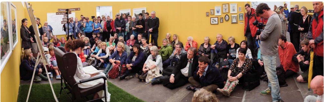
Anweledig, Cwmni'r Frân Wen

Mae'r celfyddydau'n boblogaidd y tu hwnt yng Nghymru – canu mewn corau, darllen llyfrau, mynd i'r sinema, ymweld ag orielau ac amgueddfeydd, gwrandao ar gerddoriaeth ac ymgyfranogi o ystod eang o weithgarwch creadigol. Mae'r celfyddydau'n ein gwneud yn falch ac yn hapus. Maent yn adfywio ein hymdeimlad cymunedol ac yn rhoi rhan inni ym maes ymgysylltu dinesig ehangach. A hwy hefyd sy'n helpu creu cymdeithas iachach, fwy ymgysylltiol a mwy cynhyrchiol.