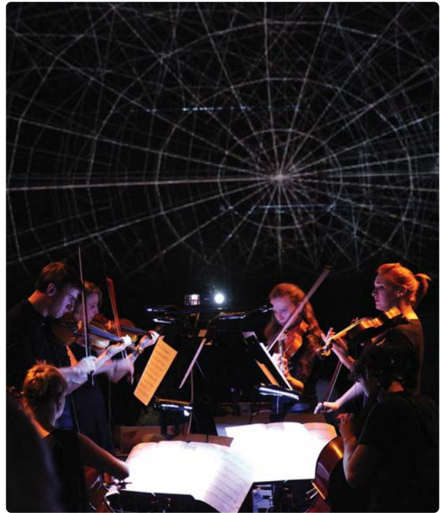
Sinfonia Cymru yn perfformio yn Mhroms Bryste 2014

Gwefan: www.cyngorcelfyddydau.cymru.org.uk