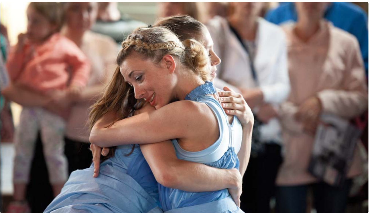
Diwrnodau Dawns, Canolfan Celfyddydau Taliesin

Dychmygwch Gymru gyda'r gred a'r awydd, pan fo'r amser yn iawn, i fentro. Nid mentro'n ffwrdd â hi neu'n anghyfrifol ond yn bwyllog ac yn hyderus, gan ddefnyddio ein crebwyll, ein gwybodaeth a'n harbenigedd. Mae ein lles dinesig yn dibynnu ar hyn. Oherwydd, os gwithiwn y ffiniau cysurlon gyda dewrder a chwilfrydedd, y byddai'n bosibl inni gyrraedd darlun cliriach o'n dyfodol sy'n ein cynnwys ac sy'n wahanol, heriol ac efallai hyd yn oed yn drawsnewidiol.